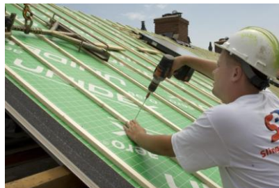
Met lange schroeven vastzetten