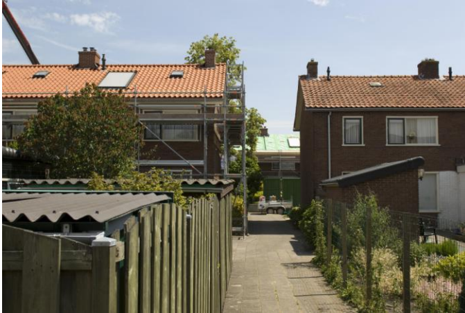
Links: het nieuwe dak Midden: het vervangingsdak Rechts: het oude dak