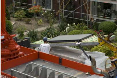
SolarTherm paneel in de takels 1