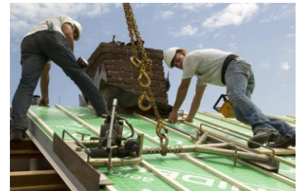
Om de schoorsteen heen