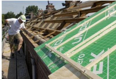
Oud naast nieuw