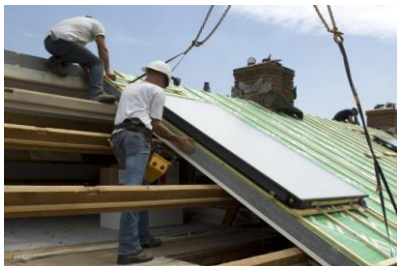
Paneel pas plaatsen