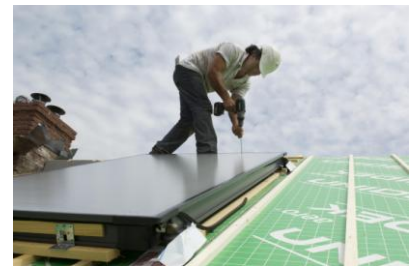
Met lange schroeven in dakspanten