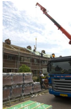
Vanaf de straat