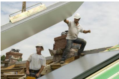
En het volgende paneel sluit weer aan