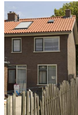
Het nieuwe dak