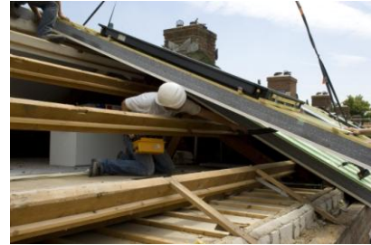
Voorzichtig met de aansluitingen binnenzijde