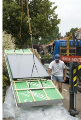
SolarTherm paneel in de takels 2