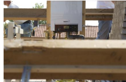
Reeds voorzien van Nefit HR-ketel