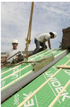
Dakpanelen op maat